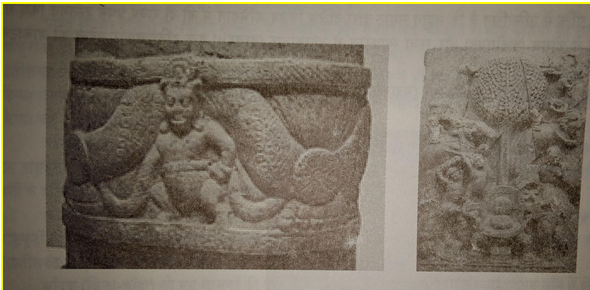
अमरावती शैली की सातवाहन कालीन मूर्ति