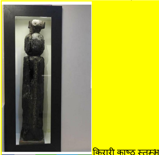
किरारी काष्ठ स्तम्भ